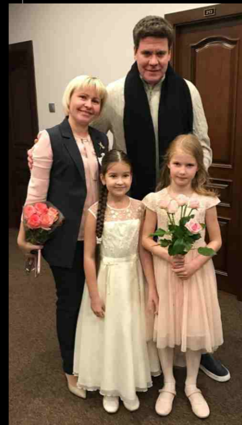
Денис Мацуев и стипендиаты фонда «Новые имена», 2022. Denis Matsuev and fellows of the Foundation "New Names", 2022.