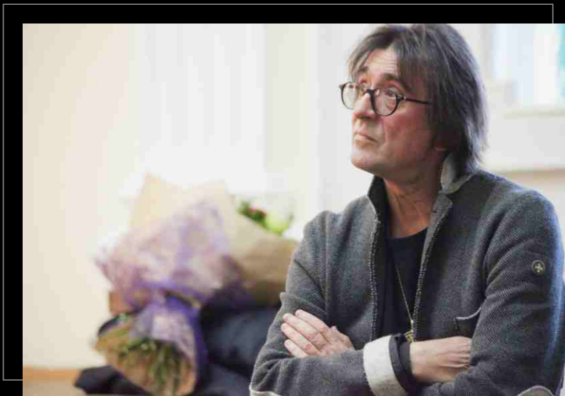
Мастер-класс Юрия Башмета в Средней специальной музыкальной школе Казанской консерватории, 2015. Master class by Yuri Bashmet at the Secondary Special Music School of the Kazan Conservatory, 2015.