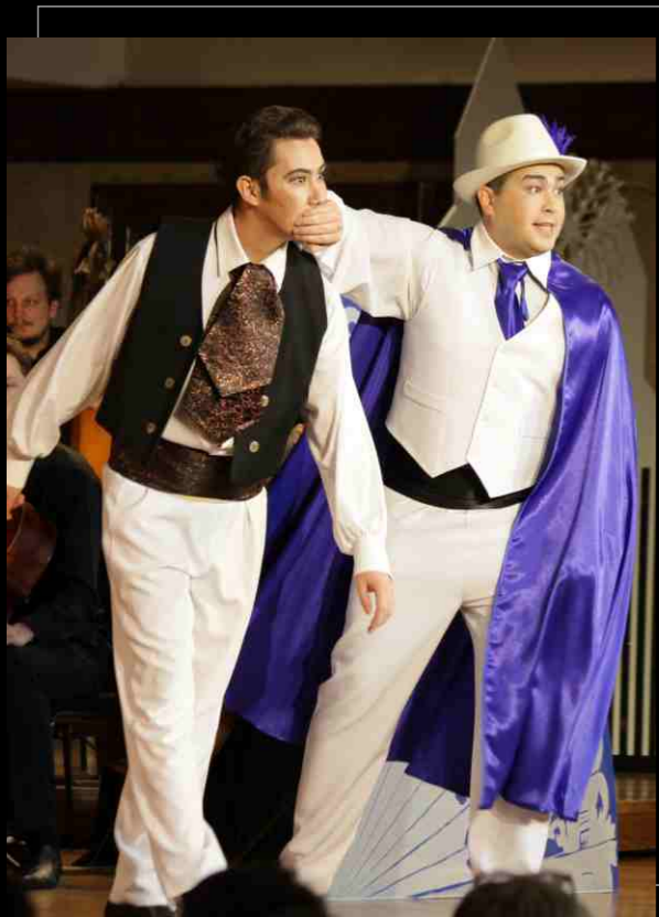
Опера Дж. Россини «Севильский цирюльник», 2021. Opera by G. Rossini "The Barber of Seville", 2021.