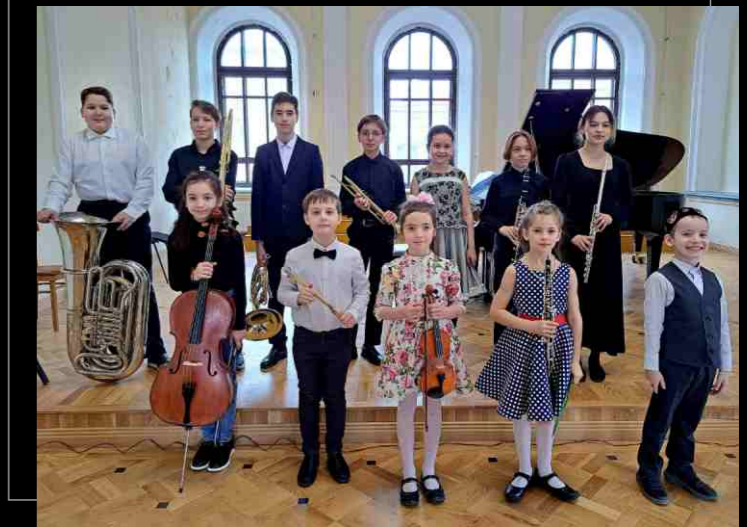
Победители исполнительских конкурсов. Performing competition winners.