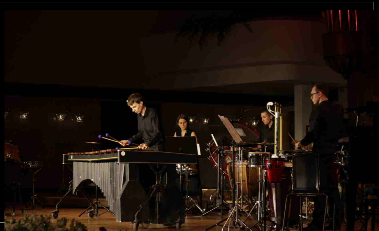
Выступление ансамбля ударных инструментов на концерте «Ритмомания», 2019. Performance of the percussion ensemble at the concert "Rhythmomania", 2019.