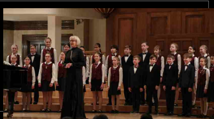
The Student's Choir of the Secondary Special Music School of the Kazan State Conservatory in the Great Concert Hall of S. Saydashev 2023.

ВОСПИТЫВАЕМ ЛАУРЕАТОВ BRINGING UP LAUREATES