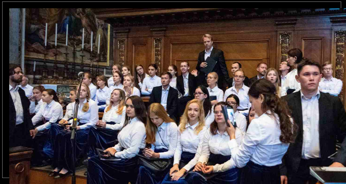
Хор студентов Казанской консерватории в Ватикане, 2019. The Student's Choir of the Kazan Conservatory in the Vatican, 2019.