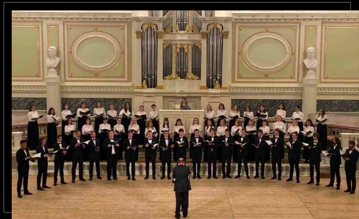
Концерт хора студентов Казанской консерватории в Капелле Санкт-Петербурга, 2022. Concert of the Student's Choir of the Kazan Conservatory in the Chapel of St. Petersburg, 2022.