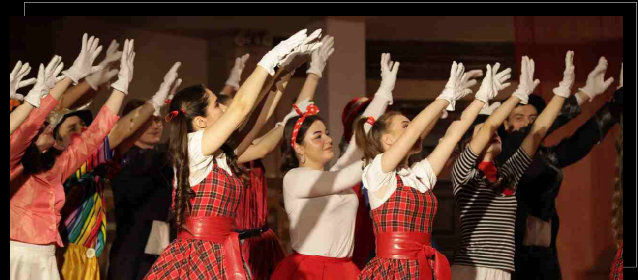
Оперетта И. Кальмана «Принцесса цирка», 2019. Operetta by I. Kalman "Princess of the Circus", 2019.