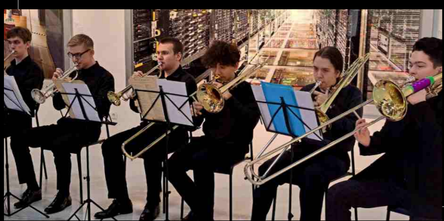
Галерея современного искусства, 2023. Gallery of Contemporary Art, 2023.