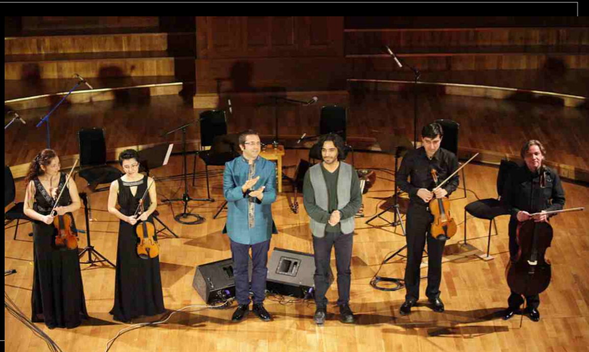
Концерт иранской классической музыки «Безвременье», 2016. Concert of Iranian classical music "Timelessness", 2016.