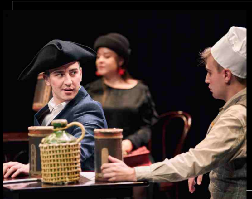
Опера Г. Доницетти «Рита» на сцене Московского театра имени Н. Сац, фестиваль музыкальных театров России «Видеть музыку», 2021. Opera by G. Donizetti "Rita" on the stage of the Moscow Theater named after N. Sats, The Festival of Musical Theaters of Russia "Videt Muzyku" ("See the Music"), 2021.