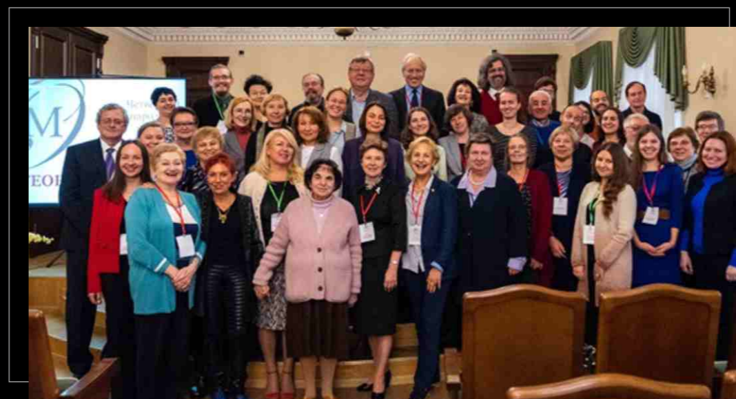
Четвертый международный конгресс Общества теории музыки «Термины, понятия и категории в музыковедении», 2019. Fourth International Congress of the Society for Music Theory "Terms, Concepts and Categories in Musicology", 2019.