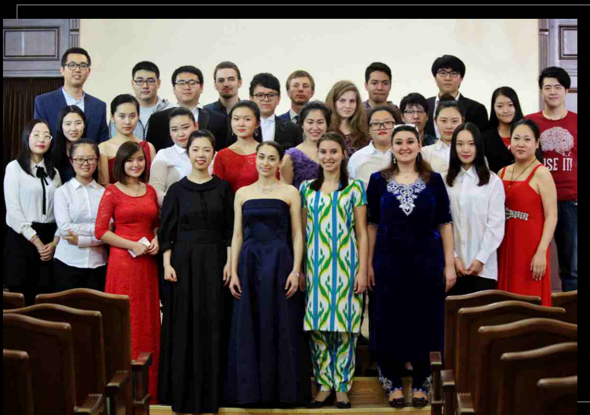
Концерт иностранных студентов «International melodies», 2016. Concert of international students "International melodies", 2016.

ПРИГЛАШАЕМ К СОТРУДНИЧЕСТВУ INVITING TO COOPERATION