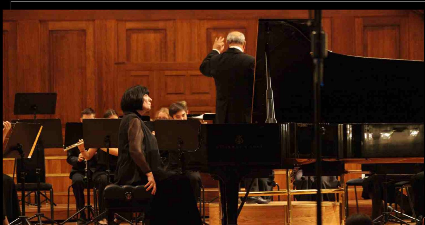
Элисо Вирсаладзе с Юниор-оркестром Казанской консерватории, 2017. Eliso Virsaladze with the Kazan Conservatory Junior Orchestra, 2017.