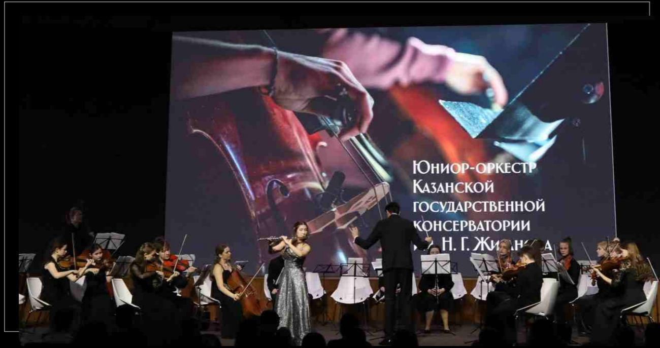
Юниор-оркестр в Университете Иннополис, 2022. Junior Orchestra at Innopolis University, 2022.

ОТКРЫВАЕМ ДОРОГУ В ПРОФЕССИЮ OPENING THE WAY TO THE PROFESSION