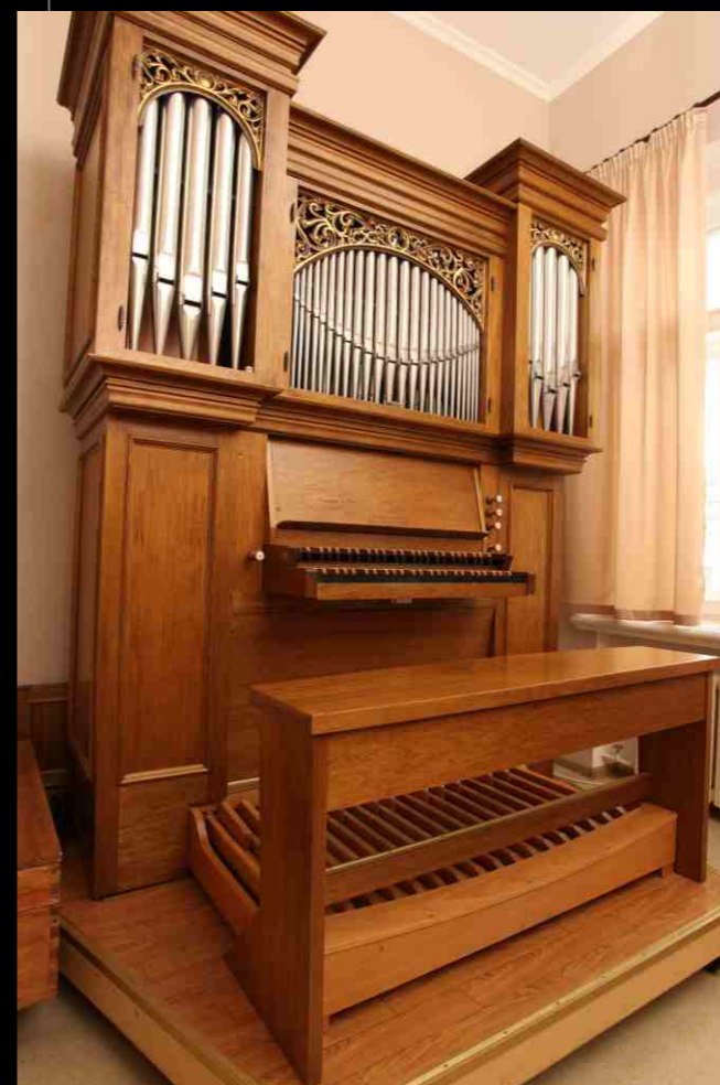
Учебный орган «Karl Loetzerich». Study organ “Karl Loetzerich”.

СОВЕРШЕНСТВУЕМ МАСТЕРСТВО IMPROVING SKILL