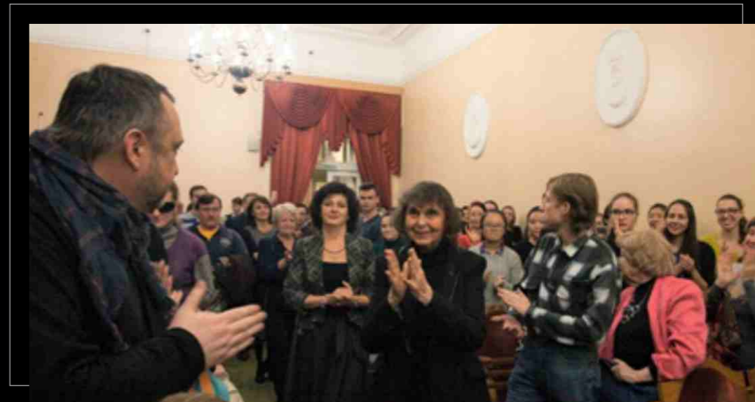
Выпускница Казанской консерватории София Губайдулина в Alma mater, 2010. Graduate of the Kazan Conservatory Sofia Gubaidulina at the Alma mater, 2010.