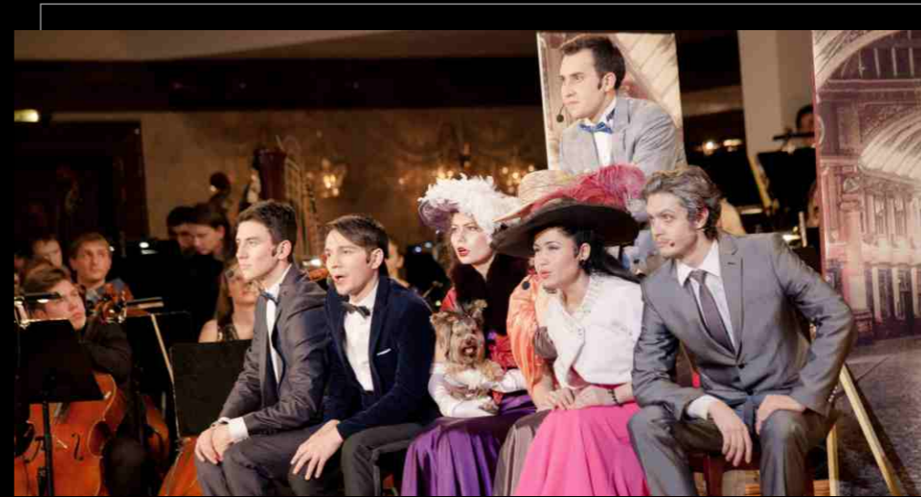
Мюзикл Ф. Лоу «Моя прекрасная леди», 2014. Musical by F. Lowe "My Fair Lady", 2014.