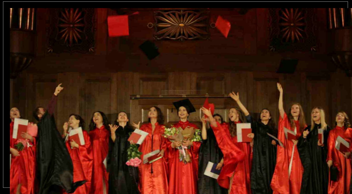
Вручение дипломов выпускникам Казанской консерватории, 2022. Presentation of diplomas to graduates of the Kazan Conservatory, 2022.