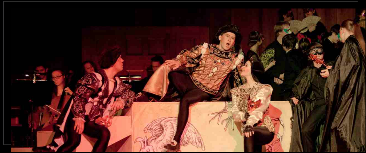
Опера Ш. Гуно «Ромео и Джульетта», 2014. Opera by Ch. Gounod "Romeo and Juliet", 2014.